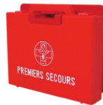
Trousse de secours