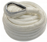
Dispositif de remorquage